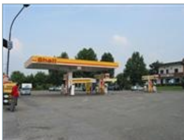
TRUCCAZZANO (MI) Strada Provinciale Rivoltana